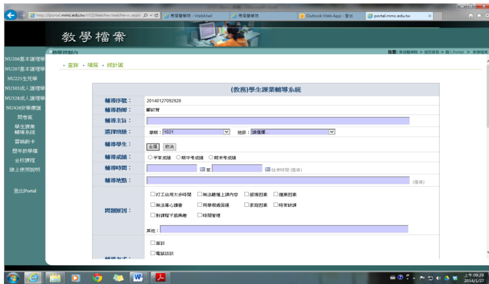
圖 3-2. 學生學習輔導 Portal 網頁

學生學業輔導方面，依據教務處學生課業不佳預警制度，教務處於每學期之期中考及期末考之後，將彙整各班級學生成績，知會各班級導師。各班級導師針對課業不佳之同學進行瞭解與輔導。