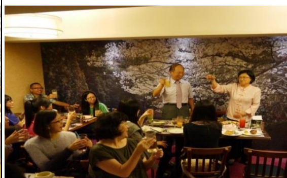
大家舉杯慶賀 All pass

本學系針對畢業生及雇主利用問卷資料搜集對學習成效之建議，藉以有效評估學生達成核心能力之程度，彙整後擬呈報本系內部關係人，如各教師及系課程委員會，檢討改進措施，確保學生之學習成