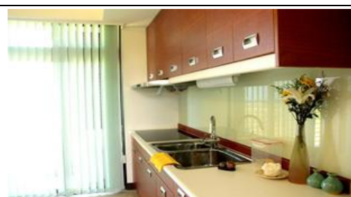
家庭式單元廚具流理台設備