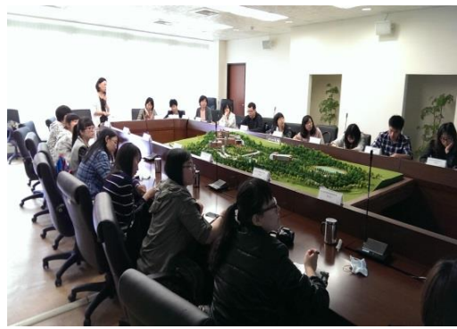
北京協和醫學院來訪