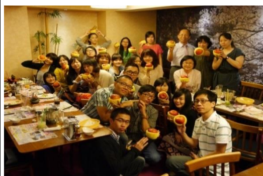
慶祝 All Pass 一人一顆蘋果