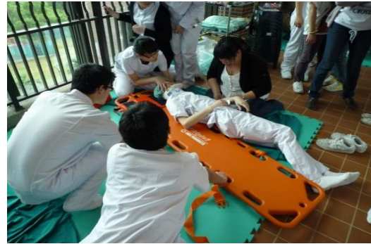
病人移動安全與舒適擺位工作坊