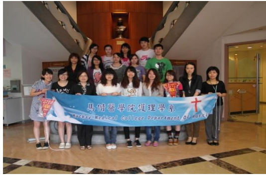
澳門鏡湖護理學院參訪