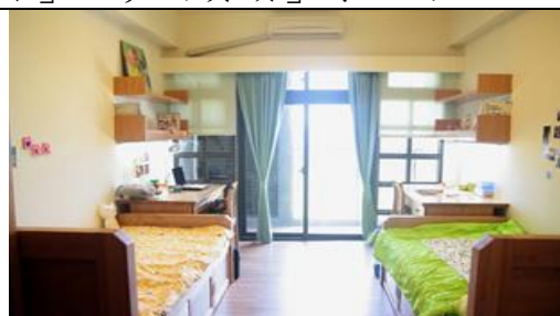
一房兩人平面床與書桌、書架

本校專業心理諮商中心對學生生活輔導服務內容如下：沿著學生宿舍生態池畔，設置漁人村。可供作為「書房」、「心靈對談空間」、「展演空間」。此外，亦辦理「感恩卡片製作」、「愛式工作坊—做糕餅送社區學童」、「包裝禮物至三芝獨居老人」、「檔案夾美化製作」、「夢的賞讀」等活動。